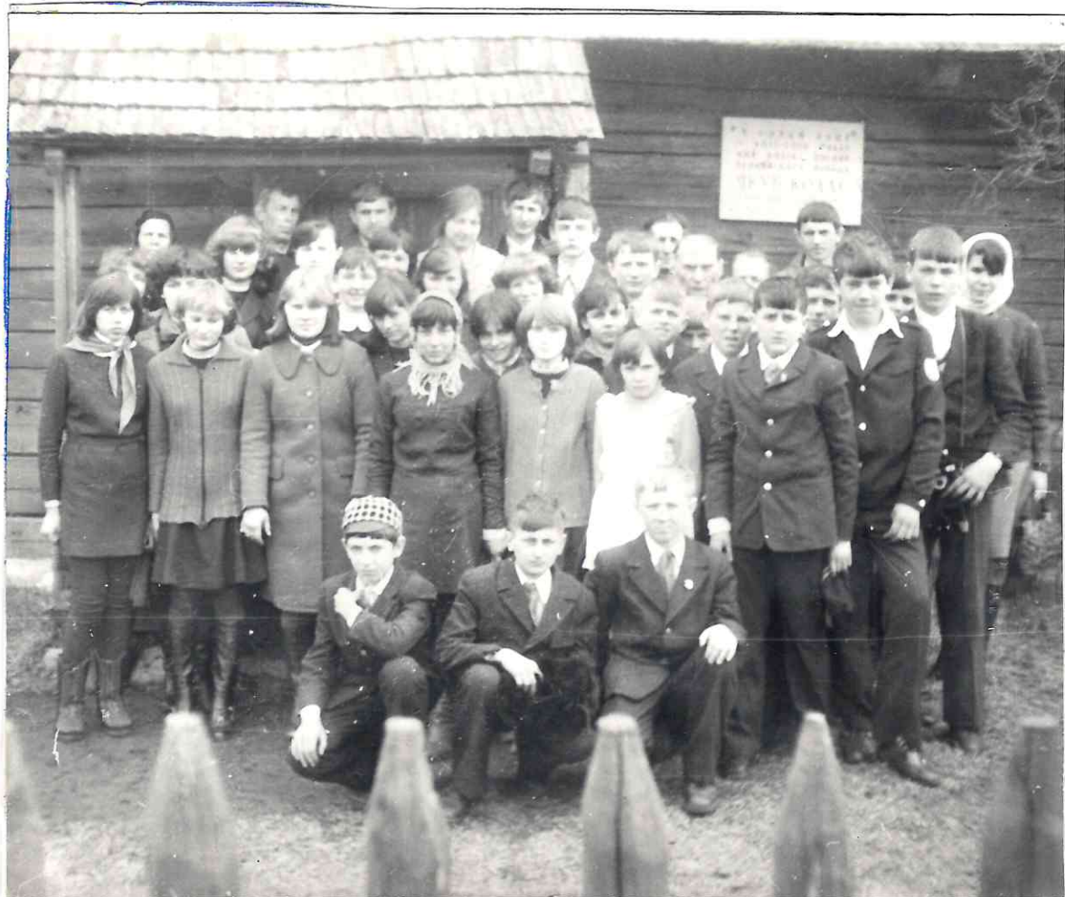
Миколаевщина 1980 год