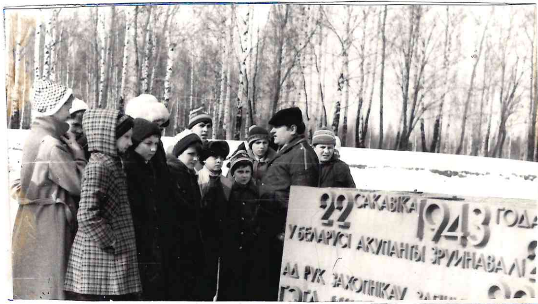
На экскурсіі в Хатыні