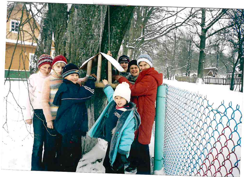
Дзіцячы сад „Журавінка” в. Нязбодзічы