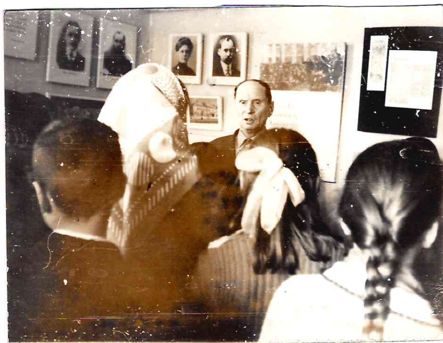
Музей Якуба Коласа