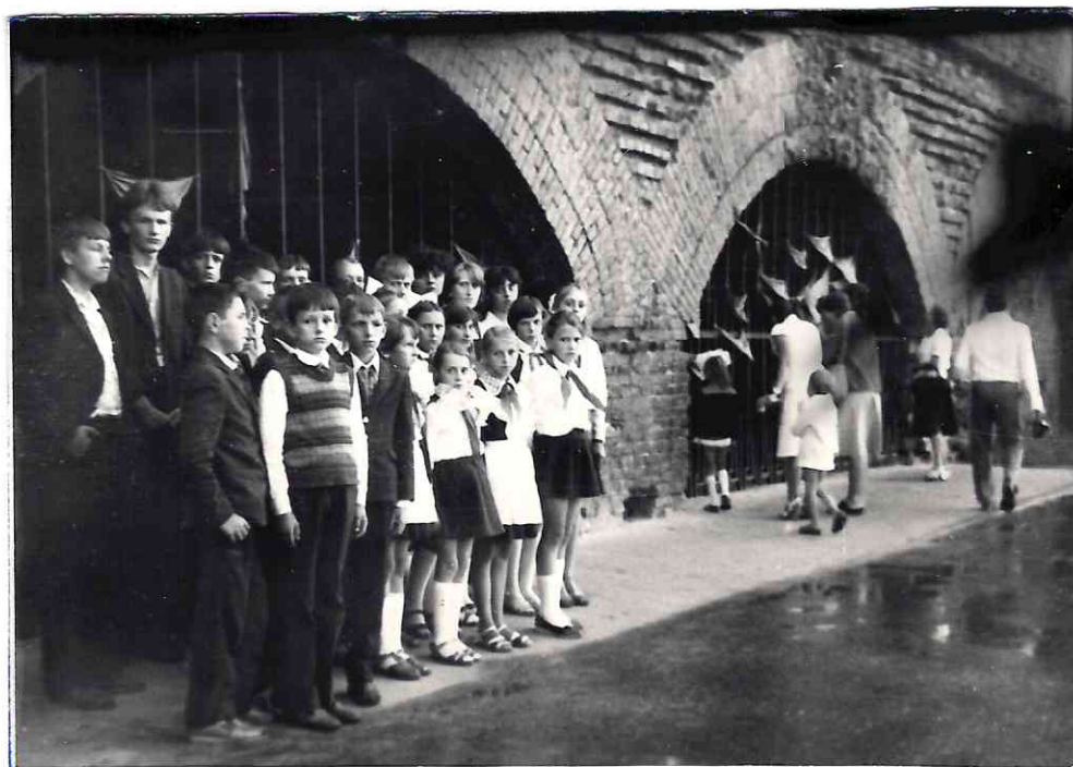
Брестская крепость – герой 1981 / 1982 г.